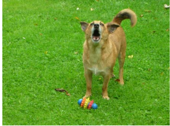
Wer spielt mit mir?