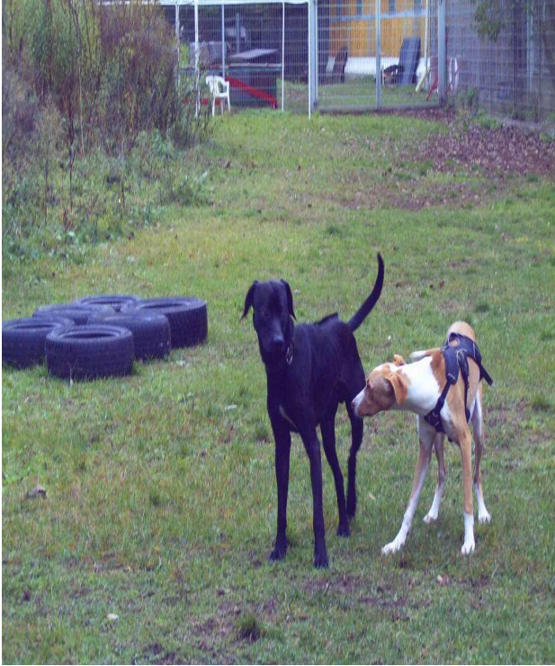
Ich und mein neuer Kumpel Alfons