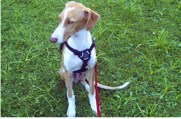
Da waren wir im Urlaub